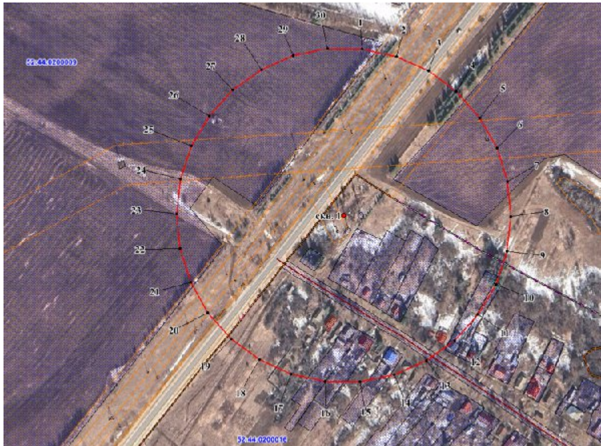
Координаты характерных точек границы третьего пояса ЗСО скважины № 1

3. Граница третьего пояса ЗСО скважины № 1 устанавливается на расстоянии 195 м от устья скважины по всем направлениям.