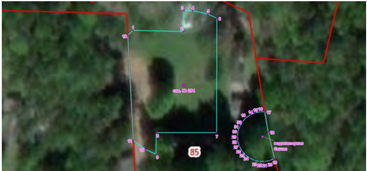
Координаты характерных точек границы первого пояса ЗСО скважины № 294